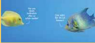
Titelbild: Ozeane und Meere - aus der Wunschkperspektive ihrer Bewohner ...