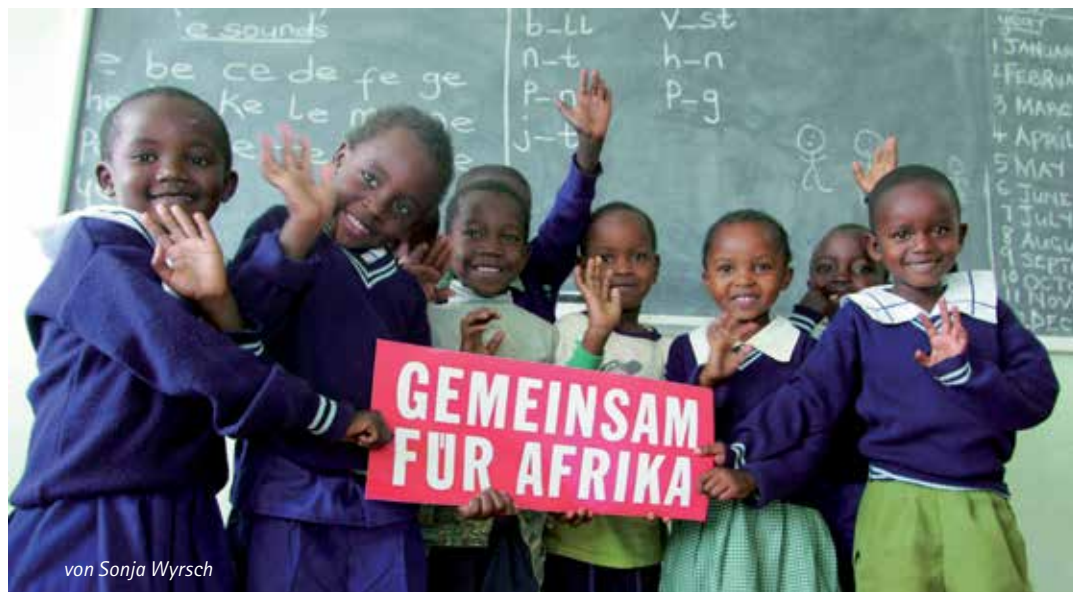
von Sonja Wyrsch